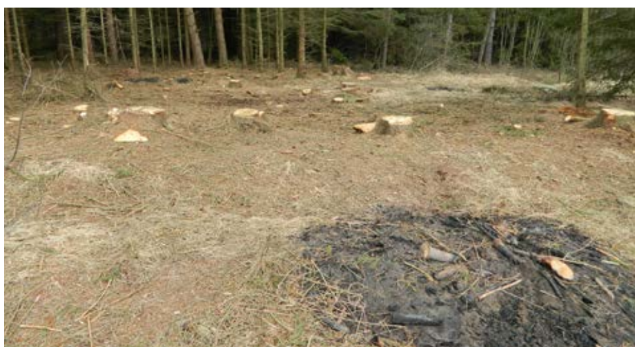
Plocha se spaleny klestem po kůrovcové těžbě