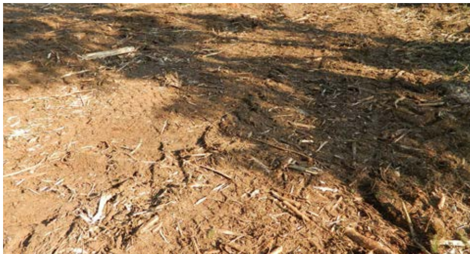
Plocha po rozdrčení klestu představuje vhodné podmínky pro uchycení náletu

Na obdrženou námitku, že živiny zůstanou pouze na místech rozložených řad klestu a budou pro stromy v okolním porostu stejně nedostupné, je snadné vysvětlit. V lese probíhá neustálý koloběh živin, kdy rozkládající se opadané jehličí a větve jsou ve formě humusu vstřebávány do půdy a odtud odebírány kořeny pro výživu stromů. Je samozřejmé, že pro živiny z rozložených řad klestu dosáhnou svými kořeny jen ty nejbližší stromy, ovšem svým opadem je opět posunou o kus dál, takže během vývoje porostu se postupně rozmístí po celé ploše porostu. Pohyb živin v půdě zajišťují také půdní živočichové a mikroorganismy a rovněž