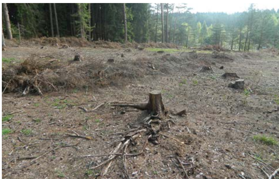
Klest uklizený na rovnoběžné rady představuje základ budoucích přibližovacích linek

Vzhledem k tomu, že ponechávání klestu v obecních lesích vyvolalo jistou kritiku a vlnu nepodložených tvrzení, byl v roce 2015 požádán Výzkumný ústav lesního hospodářství a myslivosti (VÚLHM) o zhodnocení stavu půdy v obecních lesích. Po provedeném odběru vzorků půdy a jehličí z několika lokalit a jejich vyhodnocení jsme obdrželi posudek, v němž byl konstatován „nedostatek základních živin (vápníku, hořčíku a fosforu), který se projevuje ve špatné výživě dřevin, a jednoznačně doporučeno ponechávání biomasy větví a asimilačního aparátu v porostech, protože obojí představuje významný zdroj živin pro následnou generaci lesa. Bude-li klest odstraňován, bude nutno doplnit odebrané prvky ve formě hnojení nebo vápnění a je otázka, zda zisk z prodeje klestu převyšší náklady na revitalizaci takto ochuzených půd“. K tomu dodávám, že posudek byl vypracován bezplatně v rámci lesní ochranné služby hrazené státem a pro případné zájemce je k nahlédnutí na obecním úřadu.