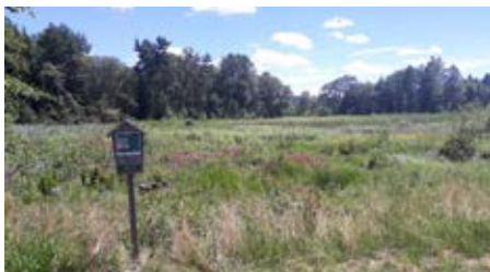
Pohled na dnes již prakticky zaniklý Obecní rybník za Sedlem ve směru na Bílou

Zdá se, že jsme se po mnoha peripetických konečně dočkali. Byli jsme úspěšní s žádostmi o dotace na naše rybníky, které již nutně potřebují nemalé investice. Projektová cena prací na odbahnění Návesního rybníka ve Lhotě je více než dva miliony korun. Dotace činí 60 procent této ceny. Projekt obnovy Obecního rybníku v Sedle počítá s celkovou sumou 5,5 milionu korun. Zde je dotace 90 procent uznatelných nákladů. Obnovený rybník v Sedle by měl mít po dokončení rozlohu cca 1 hektar při normální a 1,3 hektaru při maximální hladině. V letošním roce budeme soutěžit dodavatele akcí s tím, že samotná realizace by měla proběhnout v příštím roce. Důvodem jsou omezení a termíny, kterými jsme vázáni zejména z pohledu ochrany přírody (hnízdění ptáků, zimování obojživelníků apod.). Zároveň doufáme a věříme, že se nám podaří vysoutěžit dodavatele staveb za ceny nižší, než jsou ty projektové.