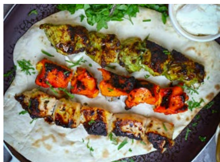
Souvlaki – kousky masa a zeleniny grilované na špízu, často podáváno s pita chlebovou plackou

Až to všechno dojdete, nelekňte se. Stává se, že vám číšník po večeři, jako pozornost podniku, naservíruje štamprlata s bílou kořalkou a třeba i kopeček zmrzliny. A když jsme u té zmrzky, nezapomeňte ochutnat jeden z typických krétských dezertů – baklavu se zmrzlinou. Je to tradiční sladkost z ořechů, medu a těsta phyllo. Když se podává teplá s kopečkem vanilkové zmrzliny