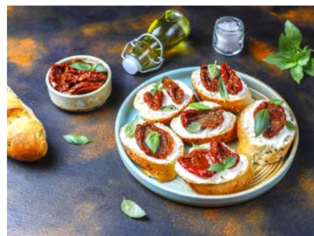
Typické krétské jídlo – dakos – suchar s rajčaty a ovčím sýrem