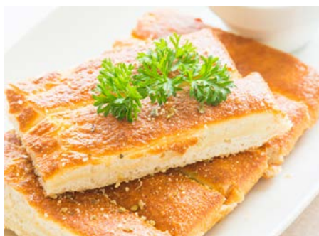
Saganaki je v podstatě obdoba našeho smaženého sýra

A ceny? Věřte, že ceny místních specialit jsou podobné, jaké zaplatíte za večeři třeba v Jindřichově Hradci. Předkrmy, které pro naplnění žaludků bohatě stačí, seženete kolem 4–6 euro (100–150 Kč) a hlavní jídla mezi 8 a 14 euro (195–340 Kč). Ceny jídel s mořskými plody a rybami se pohybují kolem 18 euro (440 Kč). Levněji se ale najíte na ulici. Tedy pokud vám nevadí street food. V tom případě není problém si ve městě dát souvlaki nebo kebab v typické pita chlebové placke za 5 euro (122 Kč), kterou budeme mít problém spořádat. A nebojte, prakticky všude se dá platit pohodlně kartou.