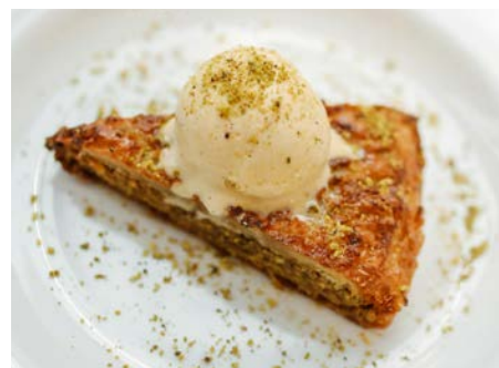
Na Krétě se balkánský dezert baklava podává s tradiční krétskou zmrzlinou