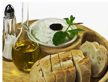
Tzatziki jsou předkrm z řeckého jogurtu, okurky, kopru, česneku, olivového oleje, soli a pepře